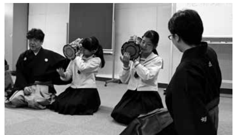
▲ワークショップの様子

この日、公益財団法人梅若会から3人の能楽師を講師として招き、参加した約25人の生徒は能の構えや摺り足などの動きを体験したり、実際に能面や楽器に触れたり、能についてたくさんのことを学んでいました。