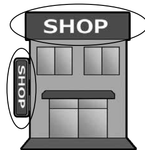
◀ 屋外広告物の一例

屋外広告物を掲出する場合は市町村長の許可が必要です。また、屋外広告業を営む場合は奈良県知事の登録が必要です。屋外広告物設置の際は、必ず登録事業者に依頼しましょう。