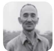
▲岸田日出男 (晩年の写真)