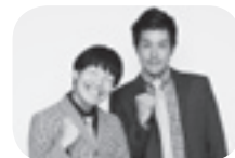
▲奈良県住みます芸人 十手リンジンもお手伝い!