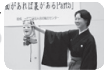
▲過去のワークショップの様子