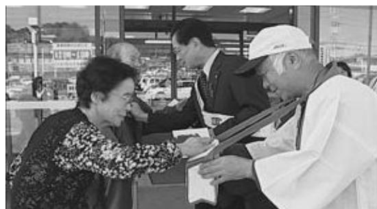
▲たくさんの方が募金に協力しました。

赤い羽根共同募金運動は12月31日まで行われます。問い合わせ先 町社会福祉協議会 ☎0747③0589