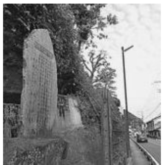
▲国道沿いに建つ頌徳碑

将来、このふるさと大淀から、日本を代表する学者が出てくることを期待してやみません。