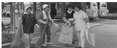
▲清掃活動を行うシルバー人材センターの会員