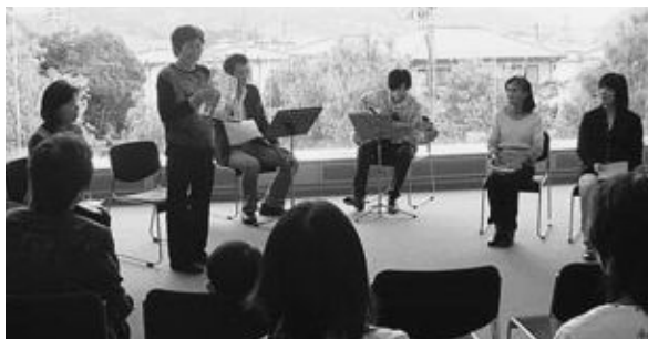
◀「耳をすまして」朗読とギターコンサート