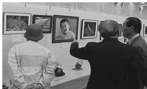
▲昨年の文化祭の様子

11月は、「第33回大淀町文化祭」「町防災訓練」「中学生が職場体験」「高齢者健康ウォーク」「ふれあいのつどい」の様子などを放送する予定です。