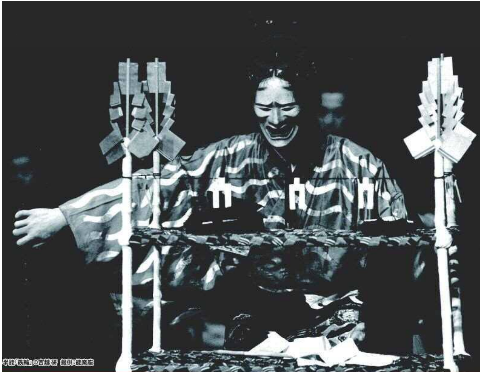
半能「鉄輪」

2025年 3月22日(土) 午後1時30分 開演 午後1時開場 午後4時30分終演予定