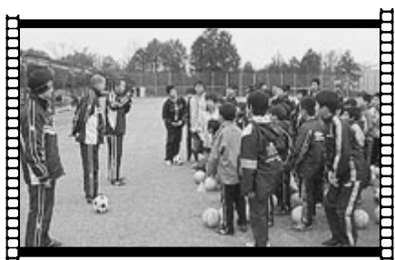
◀昨年行われた サッカー教室 の様子。

「町議会第1回定例会」「町文化講演会」 「町文化会館で人形劇公演」「サッカー教室」 「卒業式」「大和猿楽子どもフェスティバル」 などを放送する予定です。