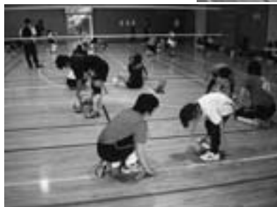
◀遊びを交えながら 楽しくバレーボール を体験