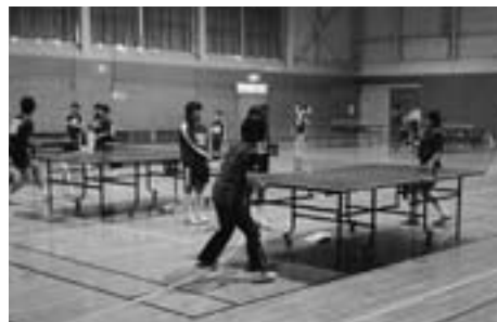
▲卓球競技の試合風景