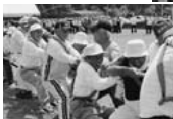
▲お題は何か？ (借り物競争)