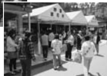
▲道の駅での街頭啓発