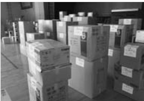
▲受付後、仕分けを行った救援物資