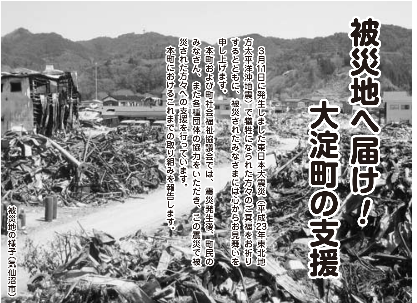
被災地の様子（気仙沼市）

本町および町社会福祉協議会では、震災発生後、町民のみなさん、また各種団体の協力をいただき、この震災で被災された方々への支援を行っています。本町におけるこれまでの取り組みを報告します。