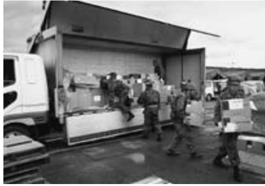
▲本町救援物資の搬入の様子(石巻市)

※ 今回搬送できなかった救援物資は、奈良県東北地方太平洋沖地震支援連絡会議に「救援物資リスト」を提出し、被災地から要請があればいつでも搬送できるよう町で保管しています。