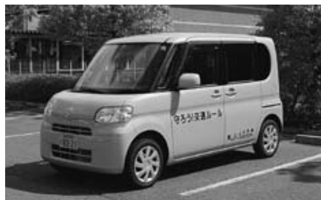
▲寄贈された交通安全指導用車両