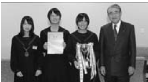
▲大淀中学校女子テニス部のみなさん

優勝できて、すごくうれしいです。これからも全国大会に向けて精一杯練習していきたいです。