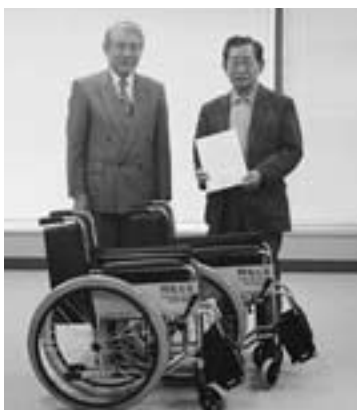
▲寄贈された車イス

一人でも多くの人に、車イスを利用してもらって喜んでいただきたいと思います。また、車イスを使ってなるべく外に出て、自然とふれあったりしてがんばってほしいです。