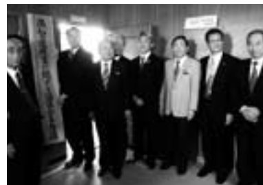
◀事務局開設オープニングセレモニーの様子

協議会では、どうすれば困難な現状を打開し、地域の医療を守ることができるのか具体的に検討を進めていきます。