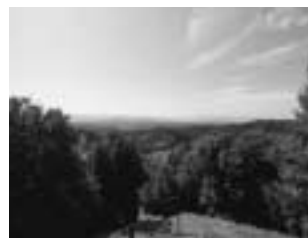
石神古墳から南を望む

大淀町大岩 大淀町ふれあいバス「おおよどパークゴルフ場前」下車。 北へ徒歩10分(道標・解説板あり)。 急な斜面を上ったところにあります。