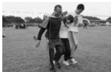
◀力をあわせて「三人四脚」