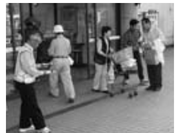
▲地域安全啓発の様子

12日(火)には町安全対策推進協議会委員のみなさんが町内大型店舗3ヶ所で買い物客に「車上・部品ねらい」「空き巣」「振り込め詐欺」等の犯罪に対する注意を呼びかけました。