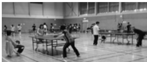
白熱した試合が繰り広げられた卓球競技▶