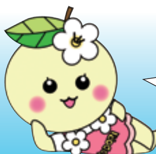
町マスコットキャラクター よどりちゃん