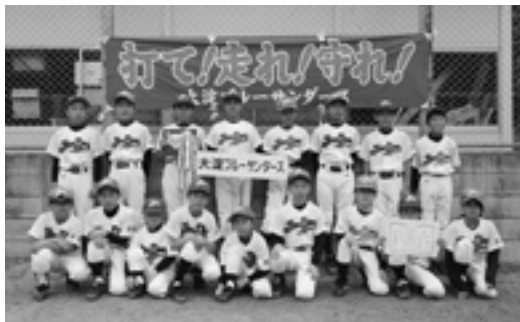
▲優勝した今木スポーツ少年団

◇大会結果 優勝 今木スポーツ少年団 準優勝 中西増スポーツ少年団 第3位 北野スポーツ少年団