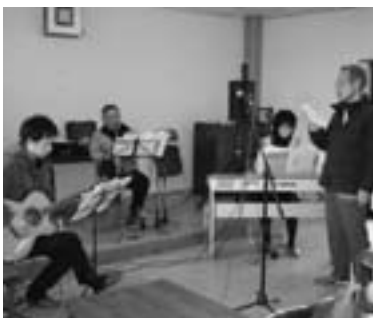
▶地域サロン活動 (歌声喫茶)