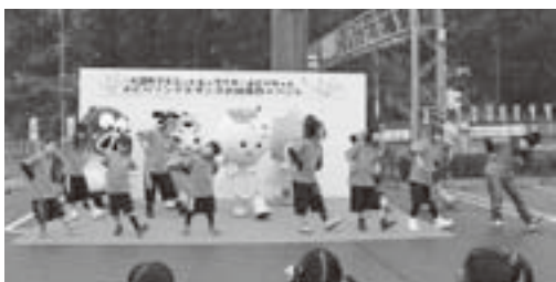
▲ダンスのお披露目

3月2日(日)に道の駅大淀センターで、よどりちゃんのテーマソング&ダンス披露イベントが開催されました。当日は、せんとくんや吉野郡内のキャラクター、よどりちゃんキッズダンスサーズが応援にかけつけ、テーマソング『よどりはあなたに恋してる』の音楽に合わせて、可憐なダンスを披露しました。 また、各町村のPRブースも設置され、本町の新しい名物「番茶スイーツ」(町商工会)も販売され、楽しいイベントになりました。