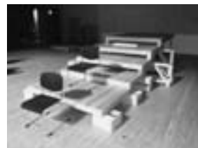
▲成人式の写真撮影用舞台の骨組み (このような舞台を作成します！)