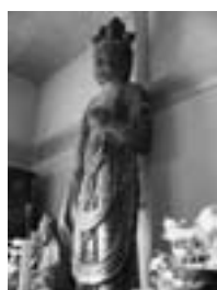
▲十一面観音立像(世尊寺)

「紀伊山地の霊場と参詣道」の世界遺産登録10周年を記念した特別展「山の神仏」に、奈良県指定文化財となっている本町世尊寺(比叡)の本造十一面観音立像が出展されます。本像は、吉野郡内に残る最も古い奈良時代の木造仏として注目され、本年はその修復事業も予定されています。この機会にぜひご覧ください。