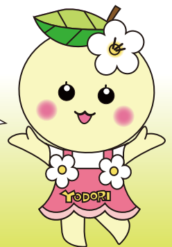
町マスコットキャラクター よどりちゃん